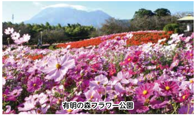
有明の森フラワー公園

市内外からたくさんの方が連日訪れ、赤やピンク、白など彩り鮮やかなコスモス畑を散策したり、写真撮影をしていました。