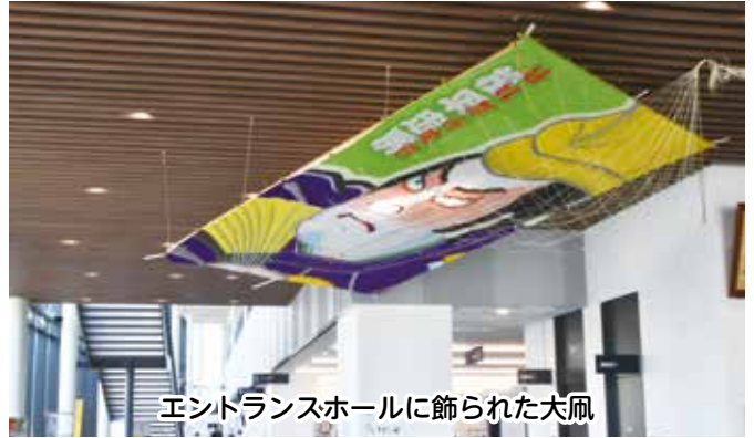
エントランスホールに飾られた大凧