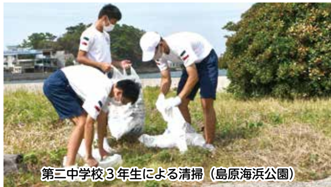
第三中学校3年生による清掃（島原海浜公園）

空き缶やペットボトル、ビニールなどのごみをたくさん拾い、島原海浜公園がとてもきれいになりました。