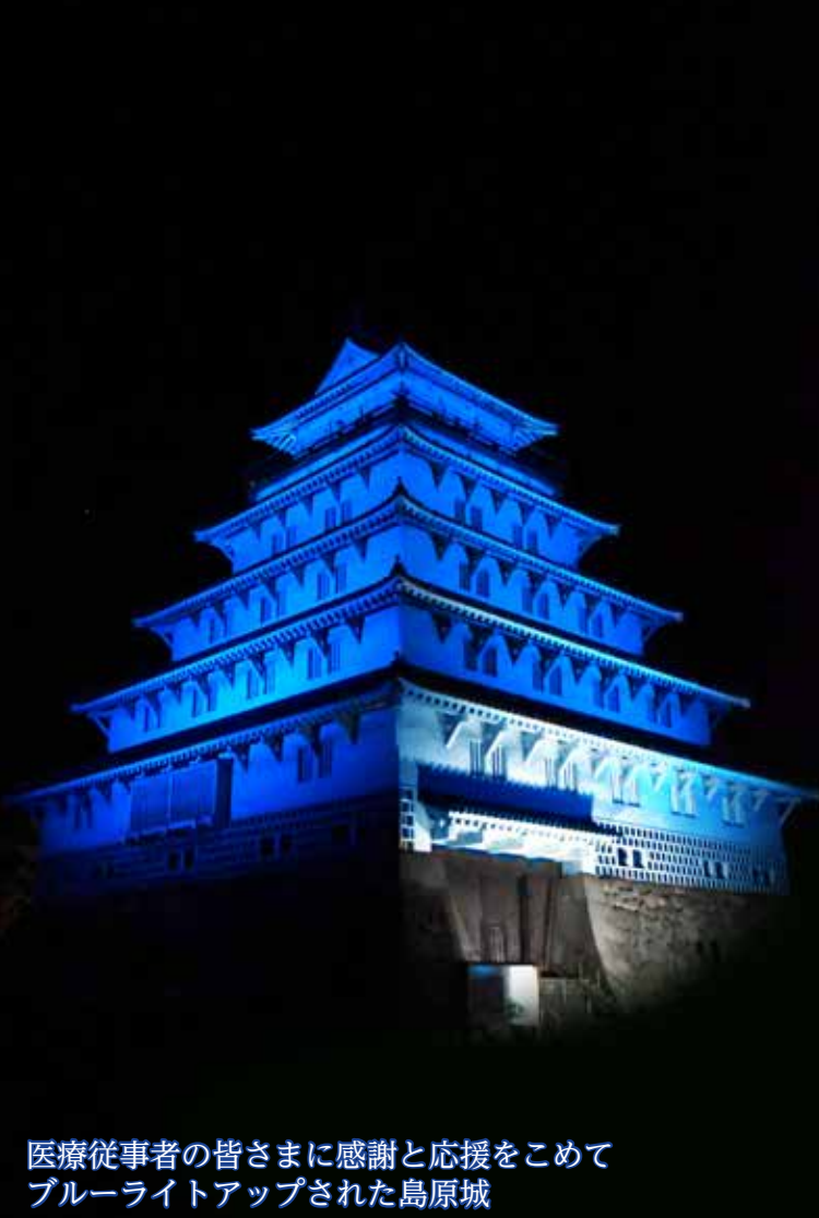
医療従事者の皆さまに感謝と応援をこめて ブルーライトアップされた島原城