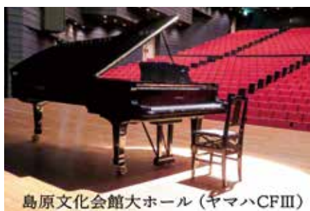
島原文化会館大ホール (ヤマハCFIII)