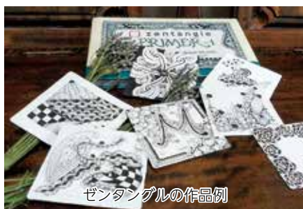
ゼンタングルの作品例