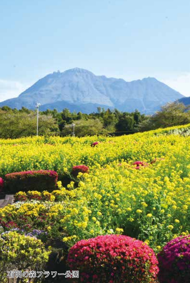
有明の森フラワー公園