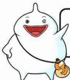
島原守護神 しまばらん