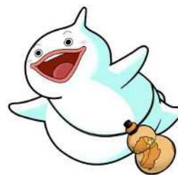
島原守護神 しまばらん

担当：島原市保険健康課 寺田、吉田 電話：0957-63-1111（内線 237） E-mail：kenko@city.shimabara.lg.jp