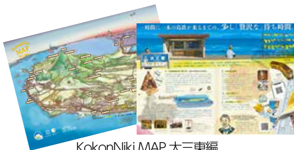
KokonNiki MAP 大三東編