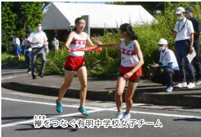
たすき 襷をつなぐ有明中学校女子チーム