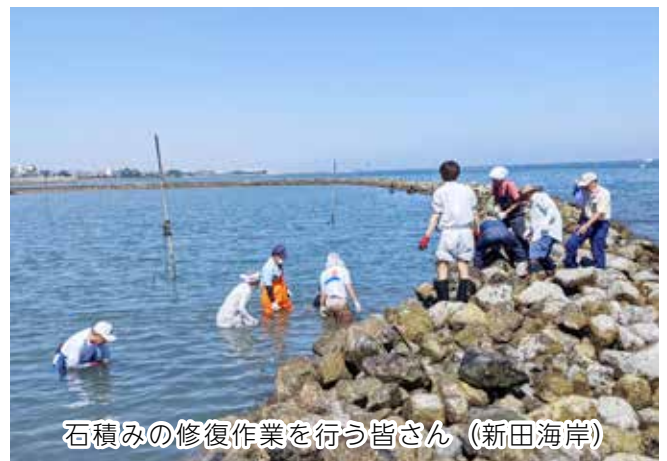
石積みの修復作業を行う皆さん（新田海岸）

海岸線に孤を描くように石を積み上げて行われるスクイ漁は、満潮時にスクイの内側に集まり取り残された魚介類を、干潮時に捕獲する仕掛けです。干満差・日本一と呼ばれる有明海に適したこの漁法を守っていただけるよう毎年行われています。