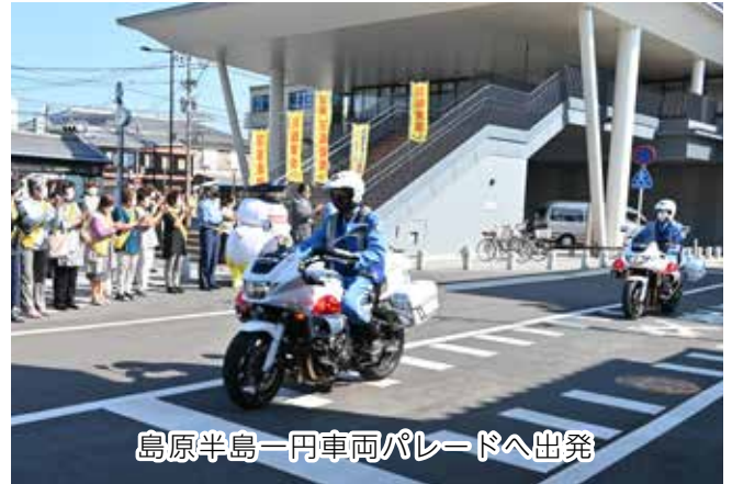
島原半島一円車両パレードへ出発

本年度は市役所で出発式を開催し、キャラバン車や広報車などの車列で交通安全を呼び掛けました。