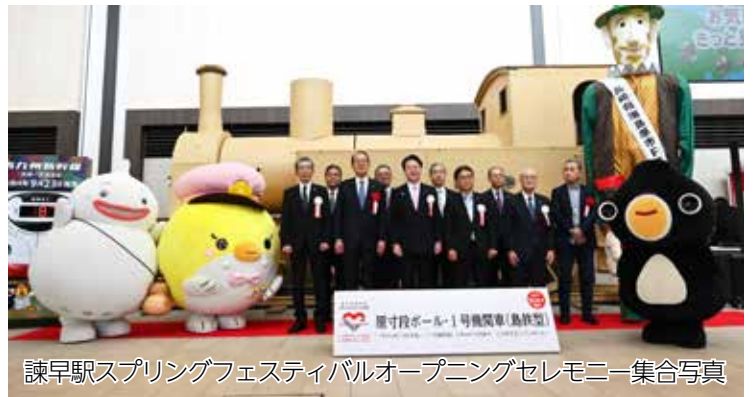
諫早駅スプリングフェスティバルオープニングセレモニー集合写真

3月20日、西九州新幹線開業まで残り半年を記念して、諫早駅スプリングフェスティバルオープニングセレモニーが開催されました！