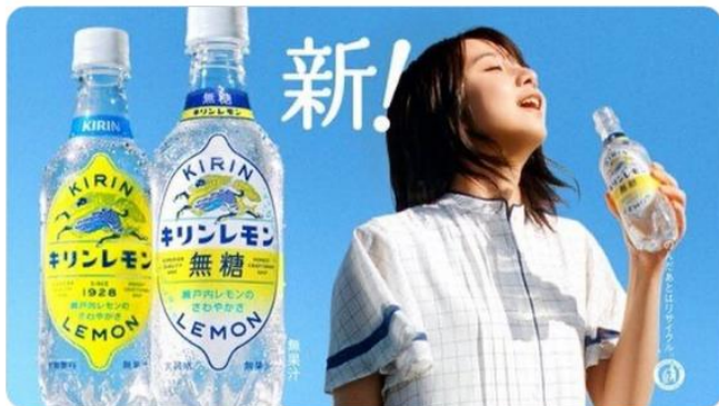
👤 キリンビバレッジ

新CM「キリンレモン 新！無糖でた。長崎大三東」編 🍋🍊 本日スタート！ 大三東駅、とてもいいところでした ぷはー！ #キリンレモン無糖