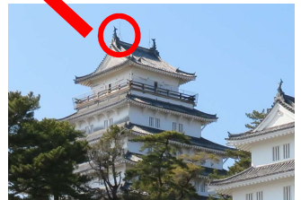
58年の役目を終えた 古い鯨(しゃちほこ)