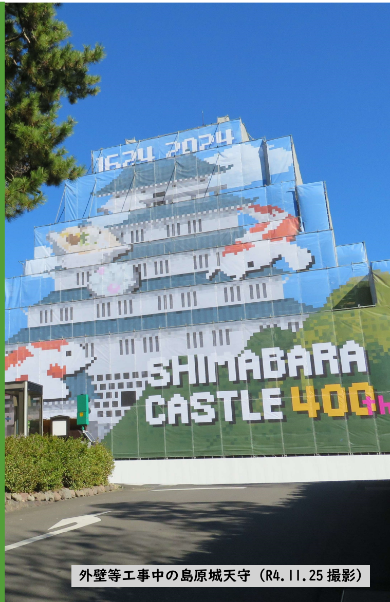
外壁等工事中の島原城天守 (R4.11.25撮影)