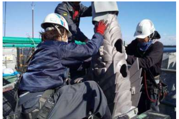
新しい鯨(しゃちほこ)の設置作業