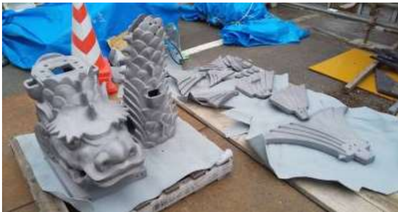
新しく設置される鯨(しゃちほこ)