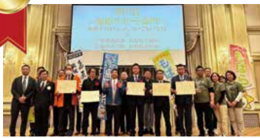
▲団長安田（安田大サーカス）さんがスペシャルゲストで駆け付けました!