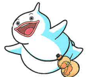
島原守護神 しまばらん

担当：島原市教育委員会社会教育課 文化財保護推進室 担当 大津、松本 電話：0957-68-1111 (内線 652) E-mail : shakyo@city.shimabara.lg.jp