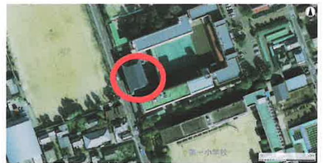
島原城三ノ丸御殿仲之御居間 推定地