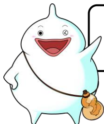
島原守護神 しまばらん