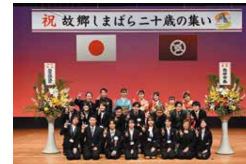
地元出身者らでつくる実行委員会(令和5年)