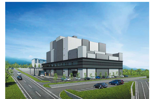
県央県南クリーンセンター完成イメージ

ごみには可燃ごみや資源ごみ、金属類などの種類があります。 きちんと分別して「ごみの減量」に取り組みましょう。 また、スプレー缶や乾電池、リチウムイオン電池などは引火する恐れがありますので、他のごみと一緒に混ぜて出さないよう、ごみを出す際は今一度確認をお願いします。