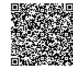
ショーモデルの申込み

前日イベント「時を結う～日本髪体験のひととき～」 結髪師による地髪での結い上げの実演 9月27日(土) 14時～ 島原文化会館 中ホール 15時～ 抹茶のおもてなし 限定50人