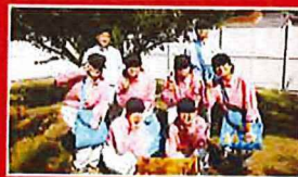
島原農業高校の生徒による収穫・加工の様子