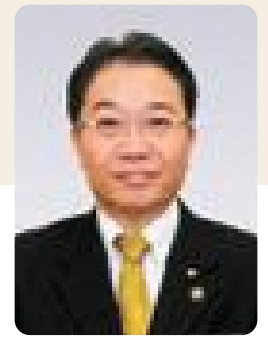
市長 古川 隆三郎