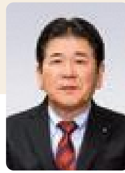
副市長 柴崎 博文