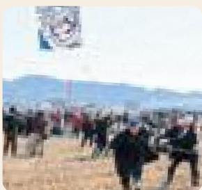
こうた風揚げまつり