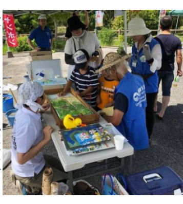
子どもたちに教える認定ジオガイドと事務局専門員 みずなし本陣ふかえ

また7月22日(日)は、土石流や地すべりなどの仕組みをわかりやすく解説する「土石流の実験」を行いました。実際に地形模型にふれて楽しむ子どもたちや、解説の様子をビデオに収める海外のお客様もいて大人気のイベントとなりました！