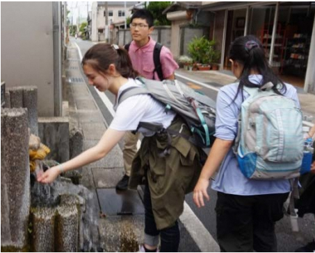
湧水にふれ、その冷たさを実感。 長庚の泉、島原市

6月27日、東京大学教養学部附属中等教育学校に人が暮らすのかを考慮した3年連続3回目。UGGの訪問は3年連続3回目。岩石標本づくりとがまだですドームの見学後、一行は平成噴火の被災地を見学。その後、「島原大変」発生前の海岸線をたどるまちあるきを行いました。湧水を飲んだり、かんざらしを食べたりしながら、なぜ活火山の近