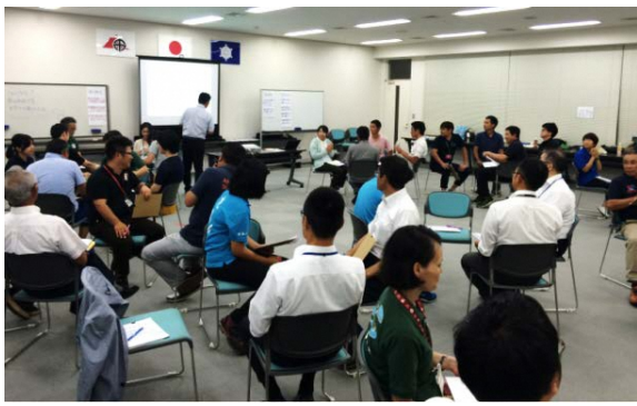
昨年の初任者研修会の様子 桜島・錦江湾GP、鹿児島県

8月21-23日にかけて、第4回九州ジオ連絡会 in 島原半島が、小浜で開催されます。九州ジオ連絡会は、年2回(夏・冬)九州内のジオパークが持ち回りで開催しています。今回は事務担当者を対象とした会議となり、会議に併せて初任者研修会やジオツアーを実施します。九州内の熱いジオパーク関係者と一緒に、九州ジオパークのネットワークを活かした活動を展開していきます！