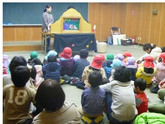
<クリスマスおはなし会>