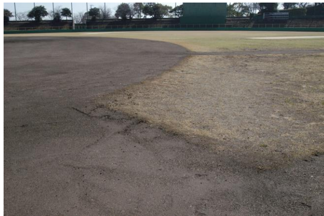
【市営球場芝張替工事】