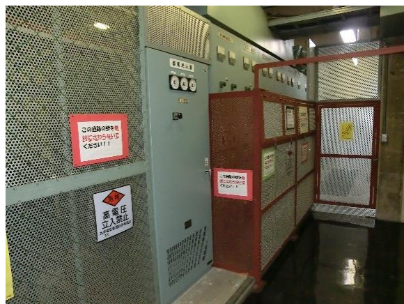
<島原文化会館高圧受電設備>