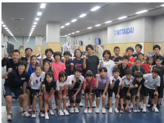
小・中学生派遣事業