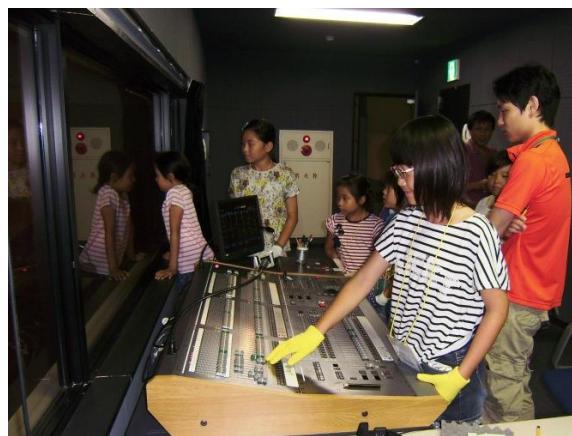
<有明文化会館バックヤードツアー>