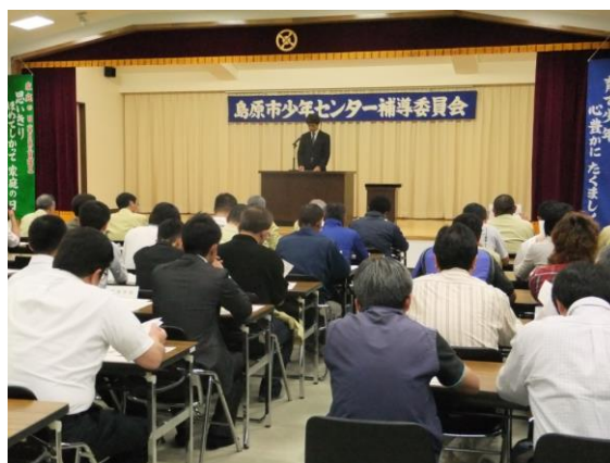
＜島原市少年センター補導委員会＞