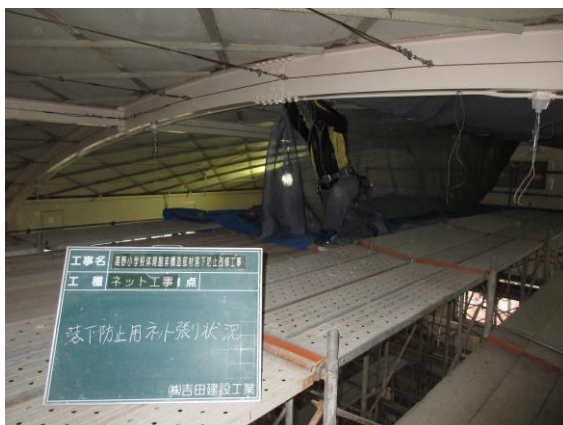
(天井ネット設置工事)