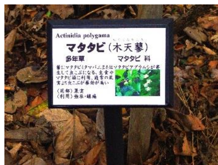
<薬園跡に設置した説明版>

来園者がゆとりをもって歩けるように園内の通路を拡幅するとともに、必要に応じ薬草や薬木の植え替え整備を行った。