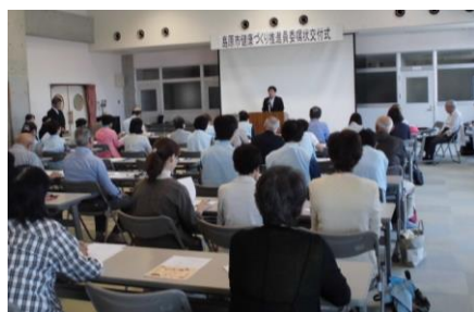
【健康づくり推進員委嘱状交付式】