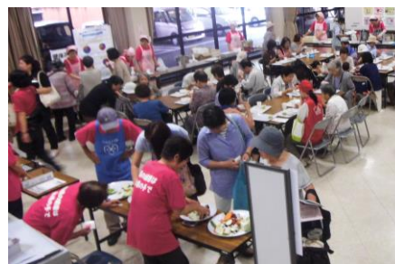
【しまばら食育フェスタ】