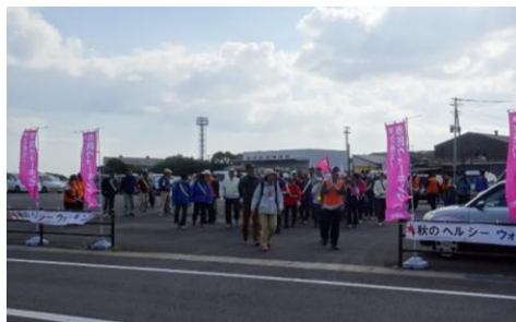
【秋のヘルシーウォーキング】