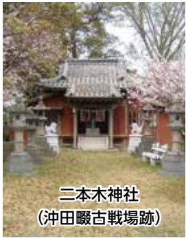
二本木神社 (沖田畷古戦場跡)