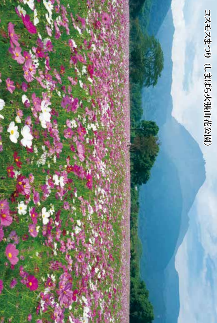
コスモスまつり (しまばら火張山花公園)