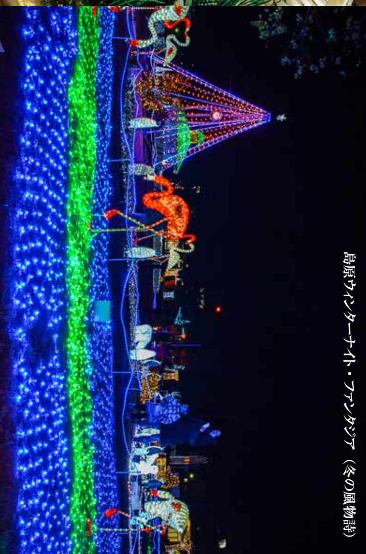
島原ウインターナイト・フエスタジア (冬の風物詩)