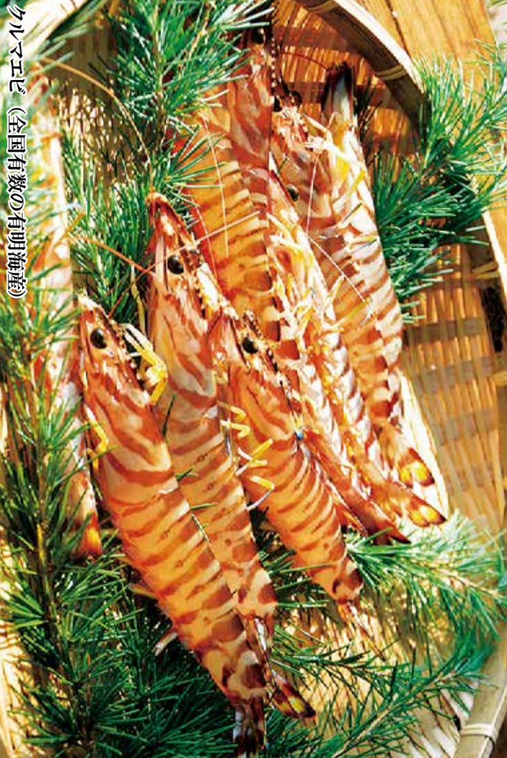
クルマエビ (全国有数の有明海産)