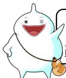
島原守護神 しまばらん