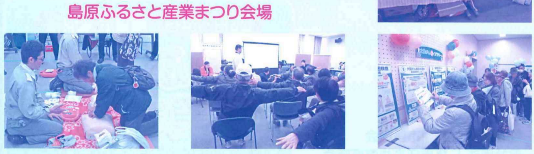
島原ふるさと産業まつり会場