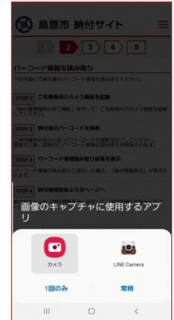
④画像のキャプチャ選択。