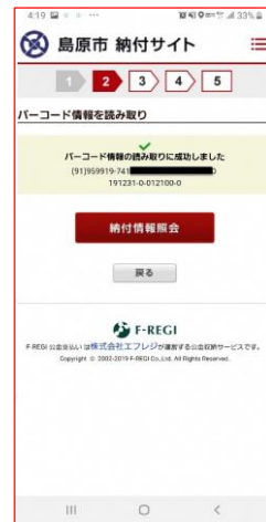
⑤バーコード情報を自動読取。 (納付情報照会をタップ)