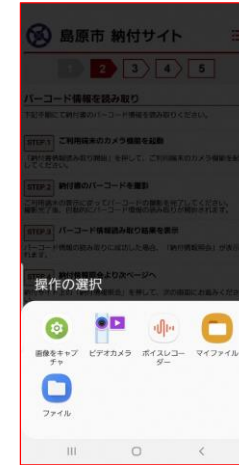
③カメラ撮影を選択。