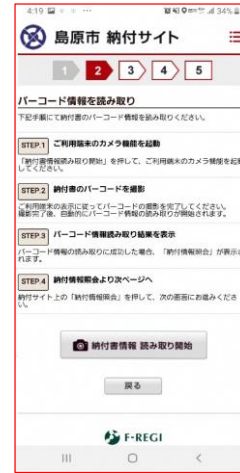
②読取開始をタップ。