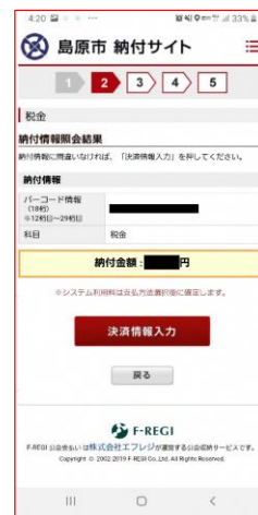
⑥納付情報照会。 (決済情報入力を入力)