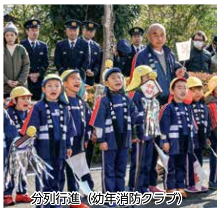
分列行進（幼年消防クラブ）