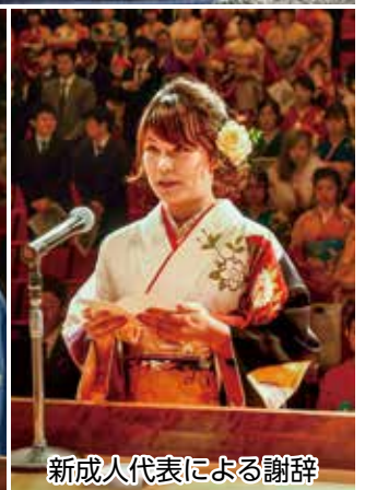
新成人代表による謝辞