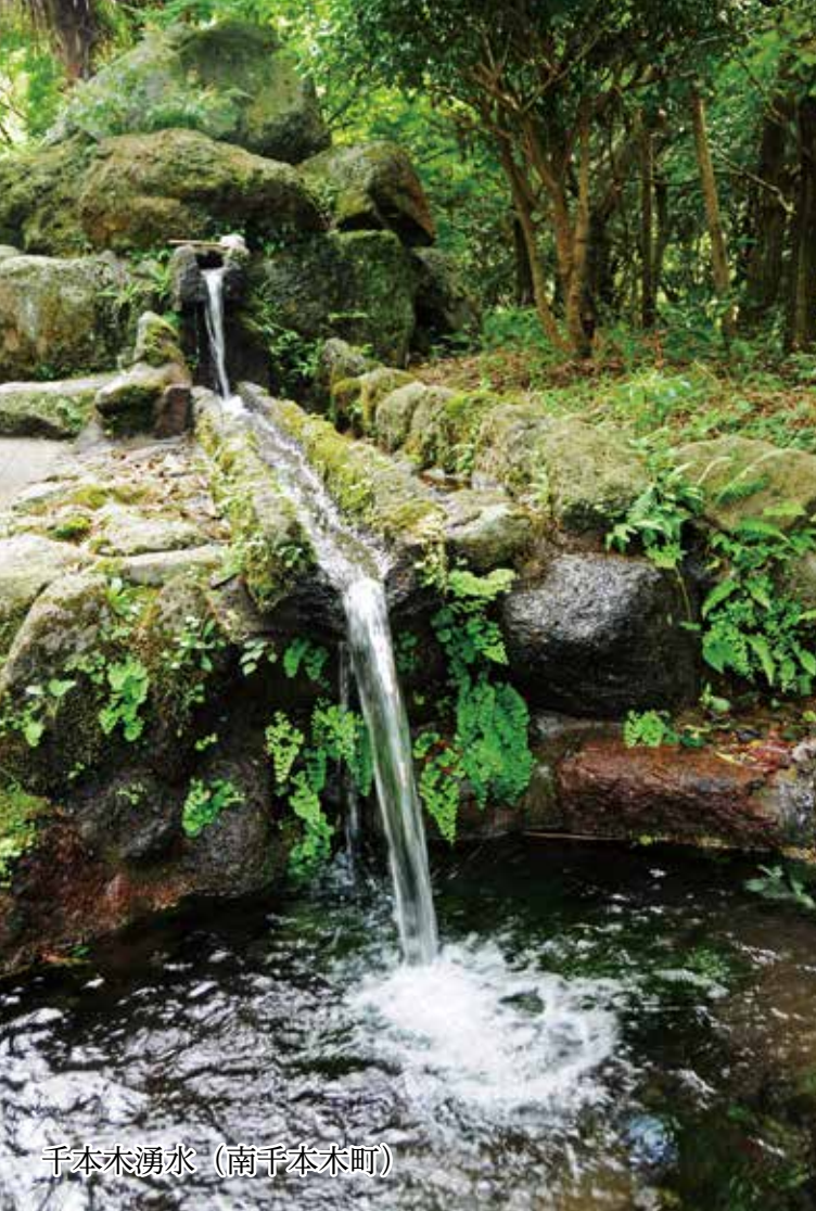
千本木湧水（南千本木町）