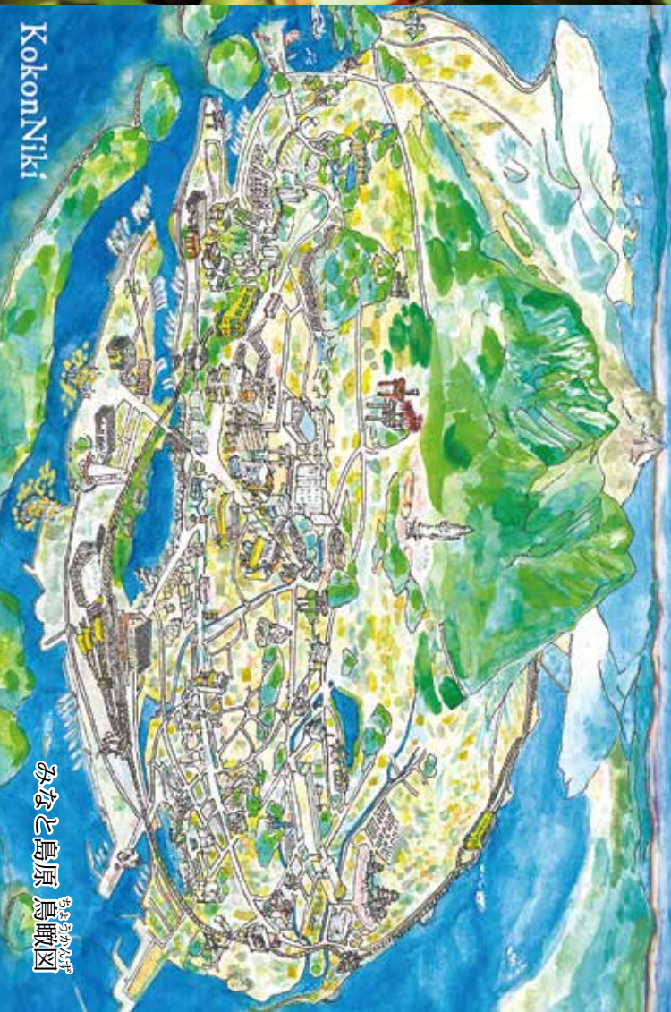
↑ 絵はがきを送って島原市をPRしましょう