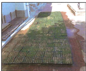
①【育成中のポット苗】