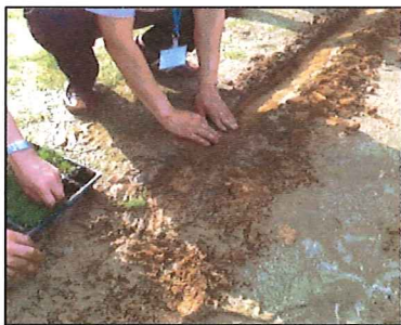
②あらかじめ機械で掘った溝に50cm間隔でポット苗を植え付けます。