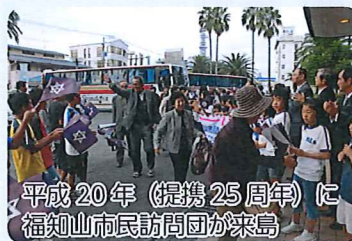
平成20年（提携25周年）に福知山市民訪問団が来島

今回の「福知山展」は、福知山市内の写真などを展示し、もっと福知山市を知ってもらおうと開催するものです。