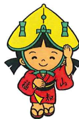
▲ 福知山市イメージキャラクター ドッコちゃん

福知山市は京都府の北西部、丹波・丹後・但馬により形成される三たん地域のちょうど中心にあります。市内は日本海に注ぐ近畿北部最大の由良川の流れをはじめとした豊かな自然に恵まれ、活気あふれる産業に栄える歴史の古い素晴らしいまちです。