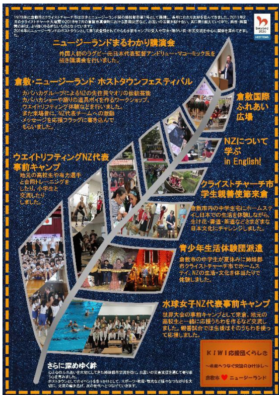
第2位 岡山県倉敷市