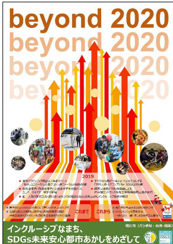
第1位 兵庫県明石市