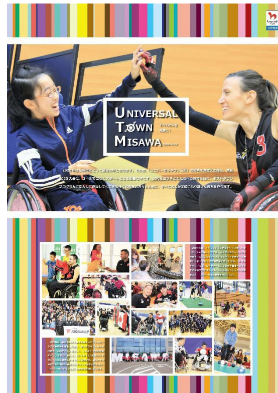
第3位 青森県三沢市