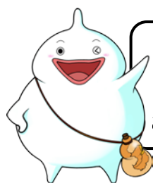
島原守護神 しまばらん