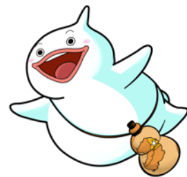
島原守護神 しまばらん