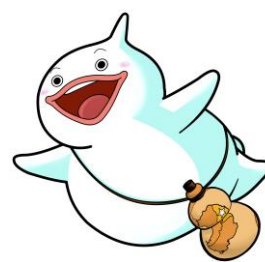
島原守護神 しまばらん

担当：島原市しまばら観光おもてなし課 観光・ジオパーク班 担当 佐藤・倉本 電話：0957-62-8019 E-mail：kanko@city.shimabara.lg.jp