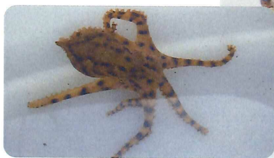
興奮していないときは青いリング模様がほとんど見えません