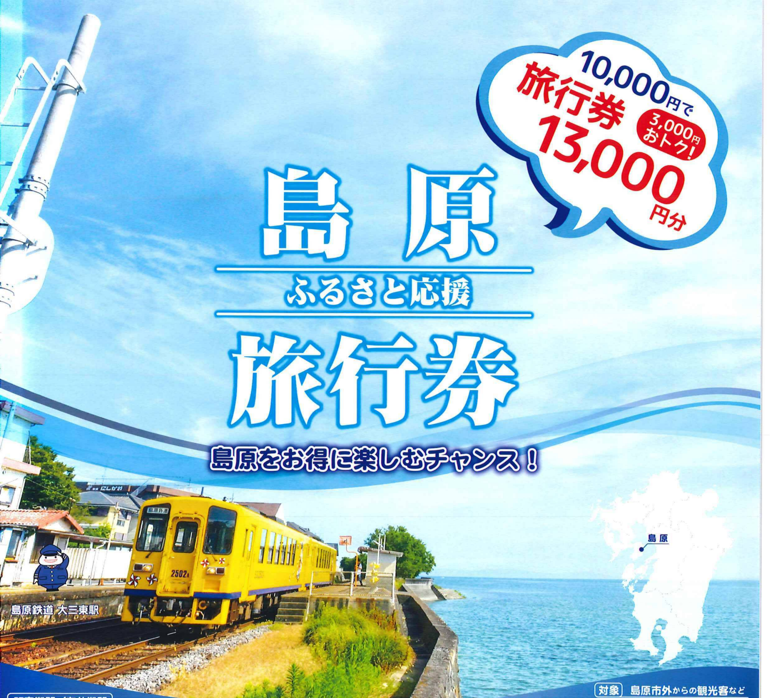
島原鉄道 大三東駅