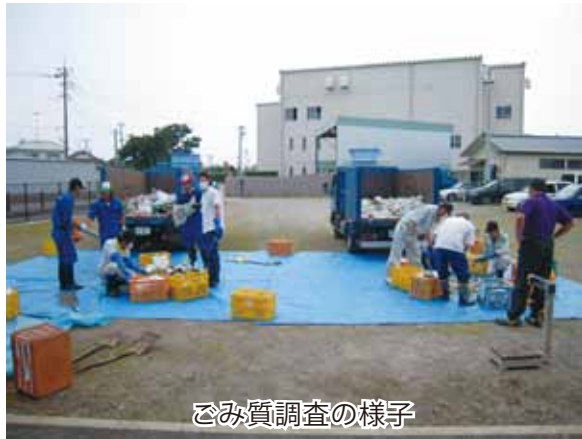
ごみ質調査の様子

こうした結果を踏まえ、生ごみ減量化を目的とした「生ごみ処理機器購入補助金」の活用や、古紙類の拠点回収およびストックヤード回収についてのさらなる周知を行いながら、ごみの減量化・リサイクルを推進していきますので、市民皆様のご理解とご協力をお願いします。