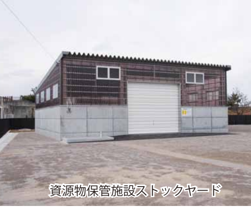
資源物保管施設ストックヤード

● 搬入手続き 土曜日、日曜日は土日開庁業務を行う市民窓口グループまたは有明支所、祝日は当直室で申請手続きを行い、搬入券の交付を受けてから搬入してください