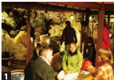
1 平成19年の「火山都市国際会議時」のおもてなし行事の様子