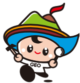
島原半島世界ジオパーク キャラクター「ジーオくん」

島原半島では、平成24年5月に「ジオパーク国際ユネスコ会議」が開催され、海外から多くのお客様がお見えになります。