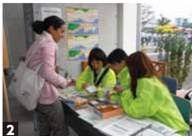
2 同じく「国際会議」時の外国語ボランティアの様子