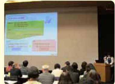
島原市の発表の様子