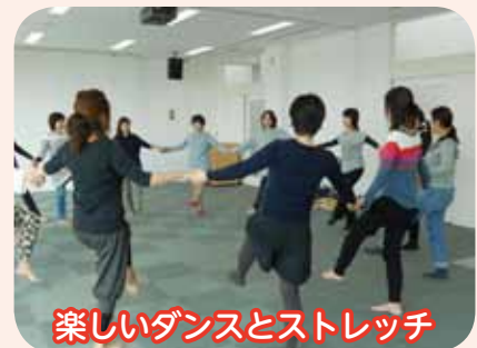
楽しいダンスとストレッチ