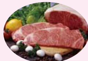
<市長賞> 長崎和牛セット

平成28年1月に開催予定の「健康しまばら21推進大会」において、応募者の中から抽選で市特産品を贈呈します