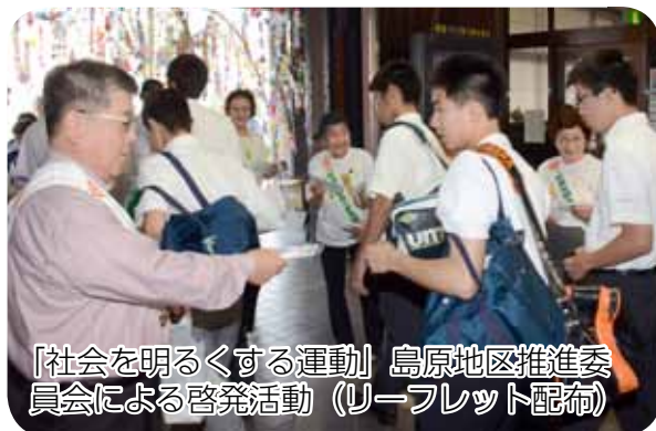
「社会を明るくする運動」島原地区推進委員会による啓発活動（リーフレット配布）